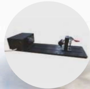
Adapter für zylindrische Objekte